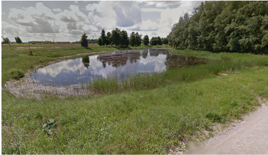
2 pav. Geležių miestelio tvenkinys ir šalia esantis parkas

Šiame projekte būtina sutvarkyti parko teritoriją bei tvenkinio krantines, pritaikant rekreaciniam naudojimui ir poilsiui. Rekomenduojama įrengti: