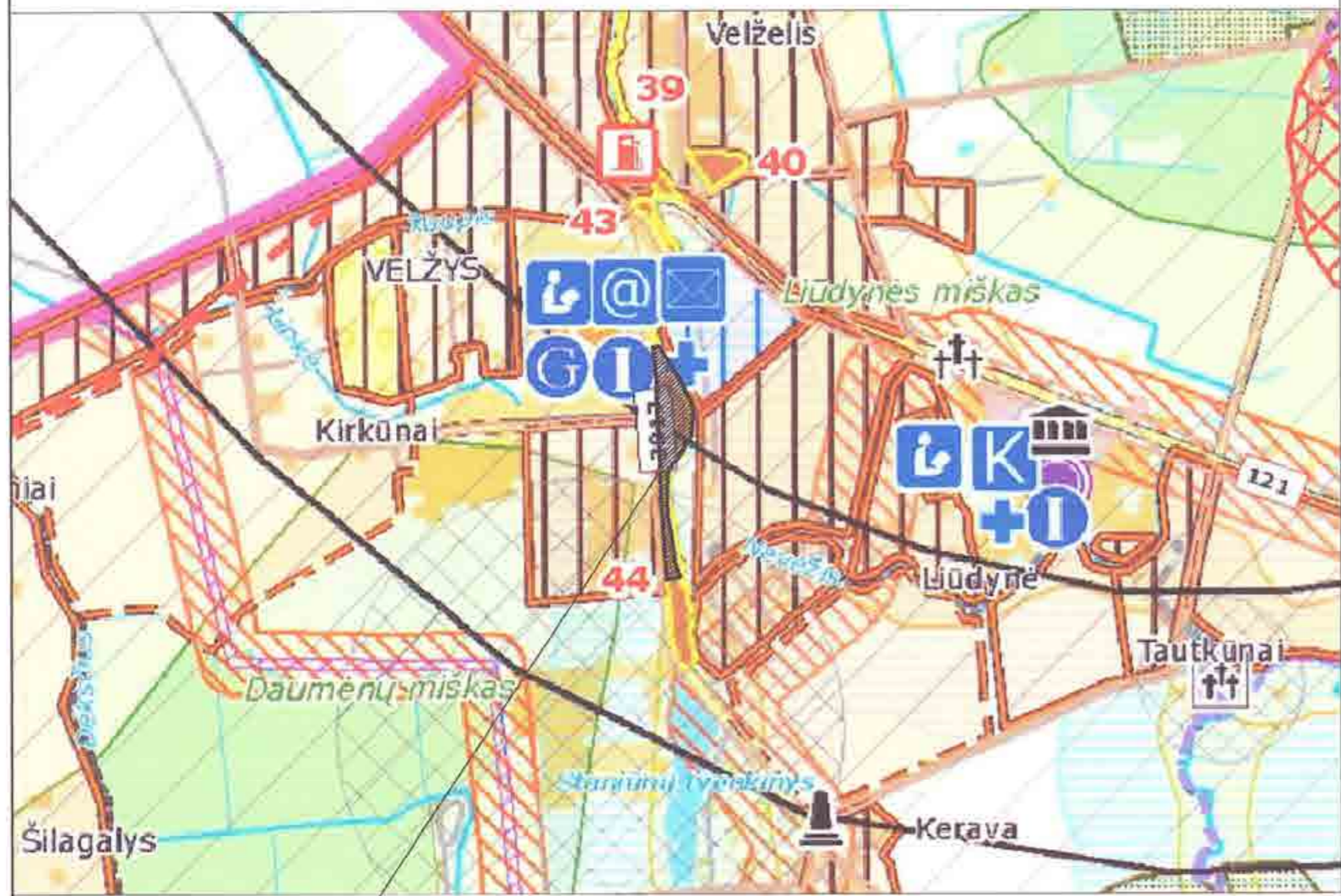
FORMUOJAMAS ŽEMĖS SKLYPAS